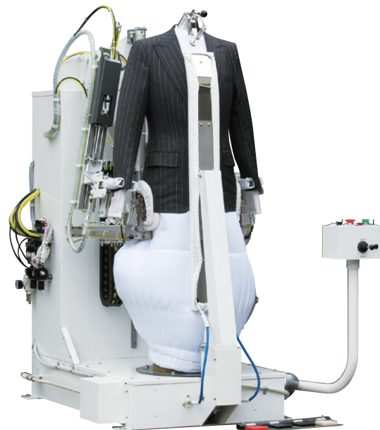
[ジャケット仕上げ状態]