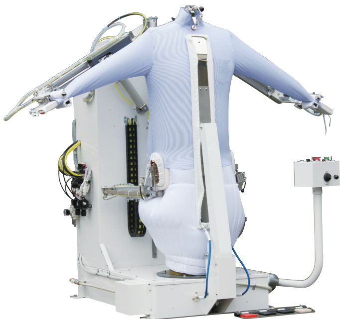
[ワイシャツ仕上げ状態]