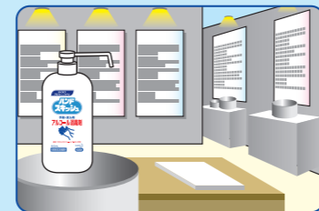
イベント会場の入り口に…