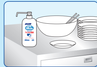
すぐ手が届く、作業台の上などに…(髪などにふれたとき)