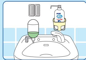
厨房入口の手洗い場、入室前の手洗い場などに…