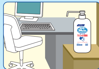
オフィス入り口に…