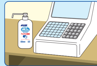
レジ等、お客様と接する場所に…